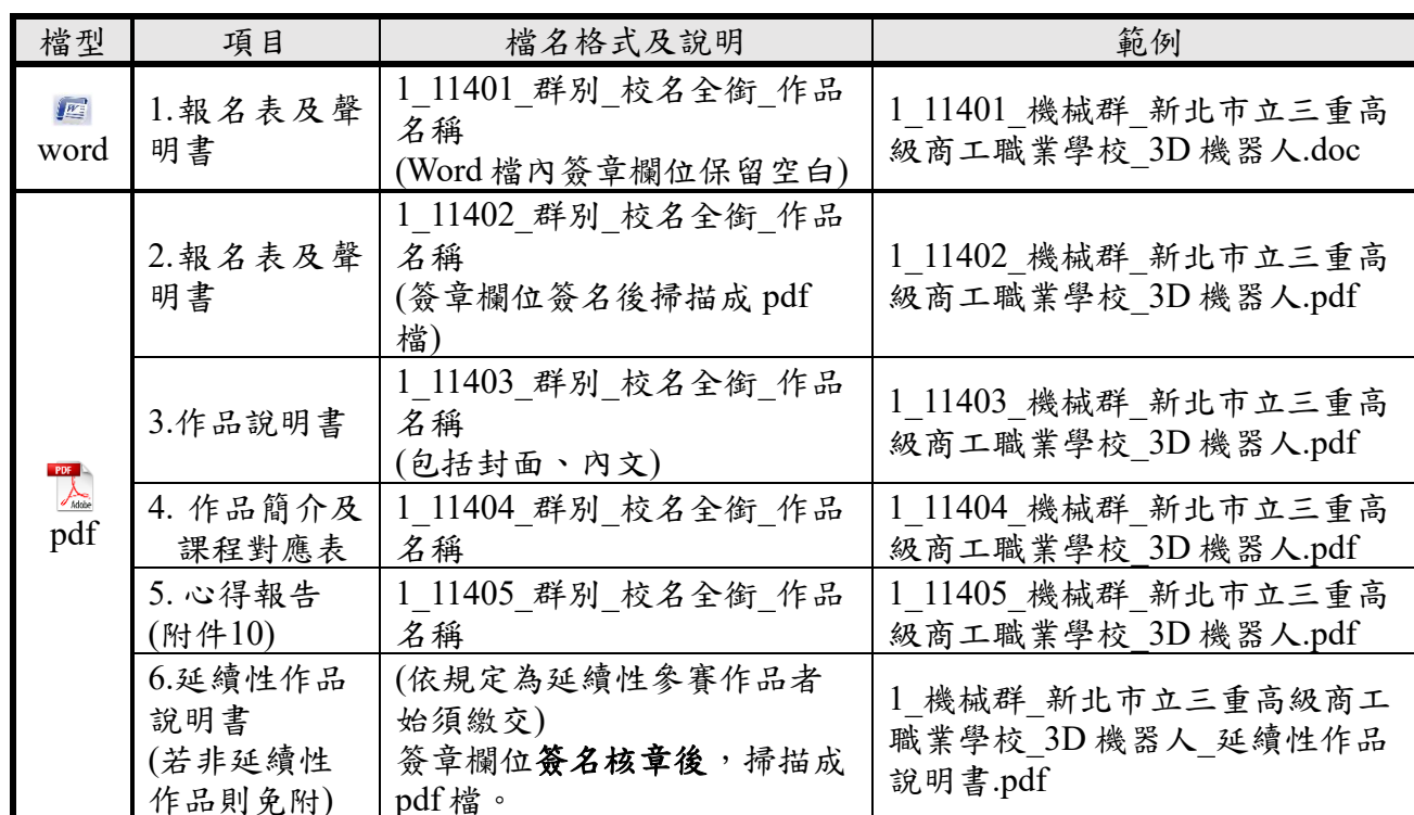
表2 專題組競賽電子檔隨身碟範例說明