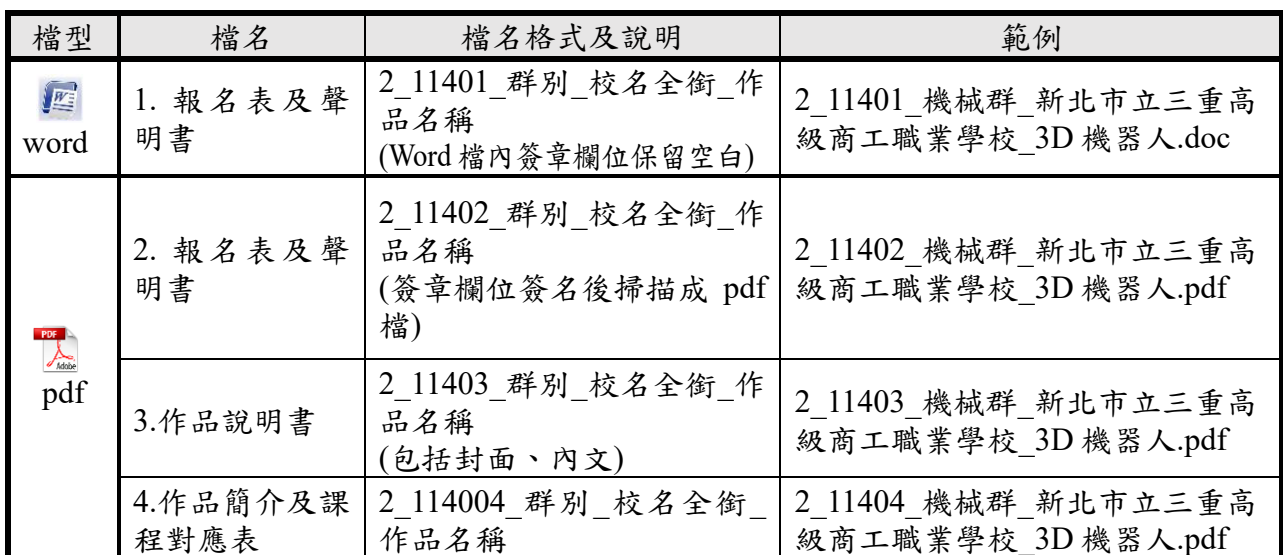
表4 創意組競賽電子檔隨身碟。範例說明