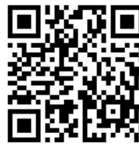
教師報名 QR code